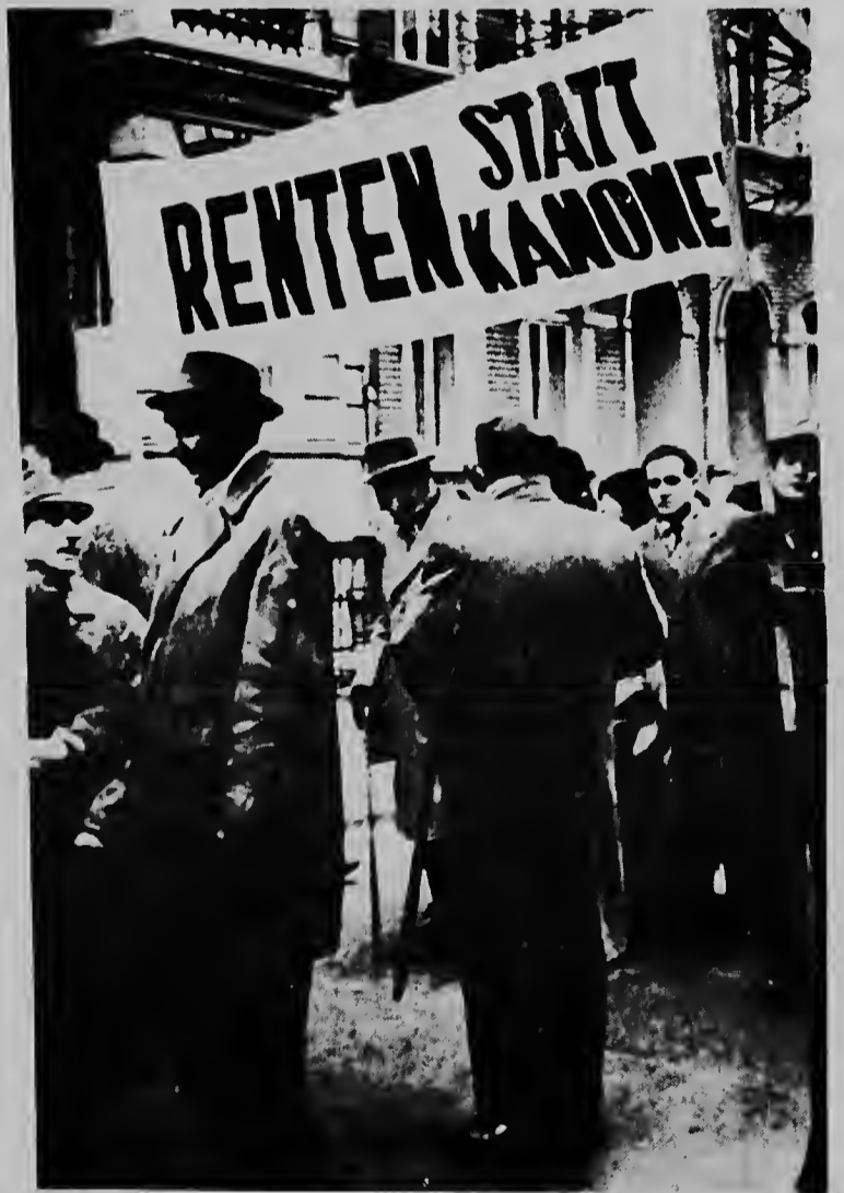
Na Alemania tabatin un demostracion contra e ley nobo di gobierno pa rebaha penshon; Aki e prome demostracion ta reuni na Bonn. E senja ta bisa „Penshon na lugar di canjonnan,,